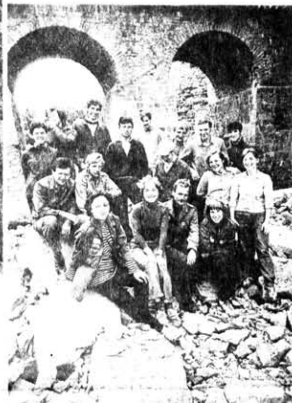
Старая крепость... Как часовые стоят четыре сторожевые башни, на развалинах Спасо-Преображенского собора буйно разрослась бузина. Восьмое лето работает на реставрации Колпорской крепости отряд «Реставратор», созданный на архитектурном факультете Инженерно-строительного института.