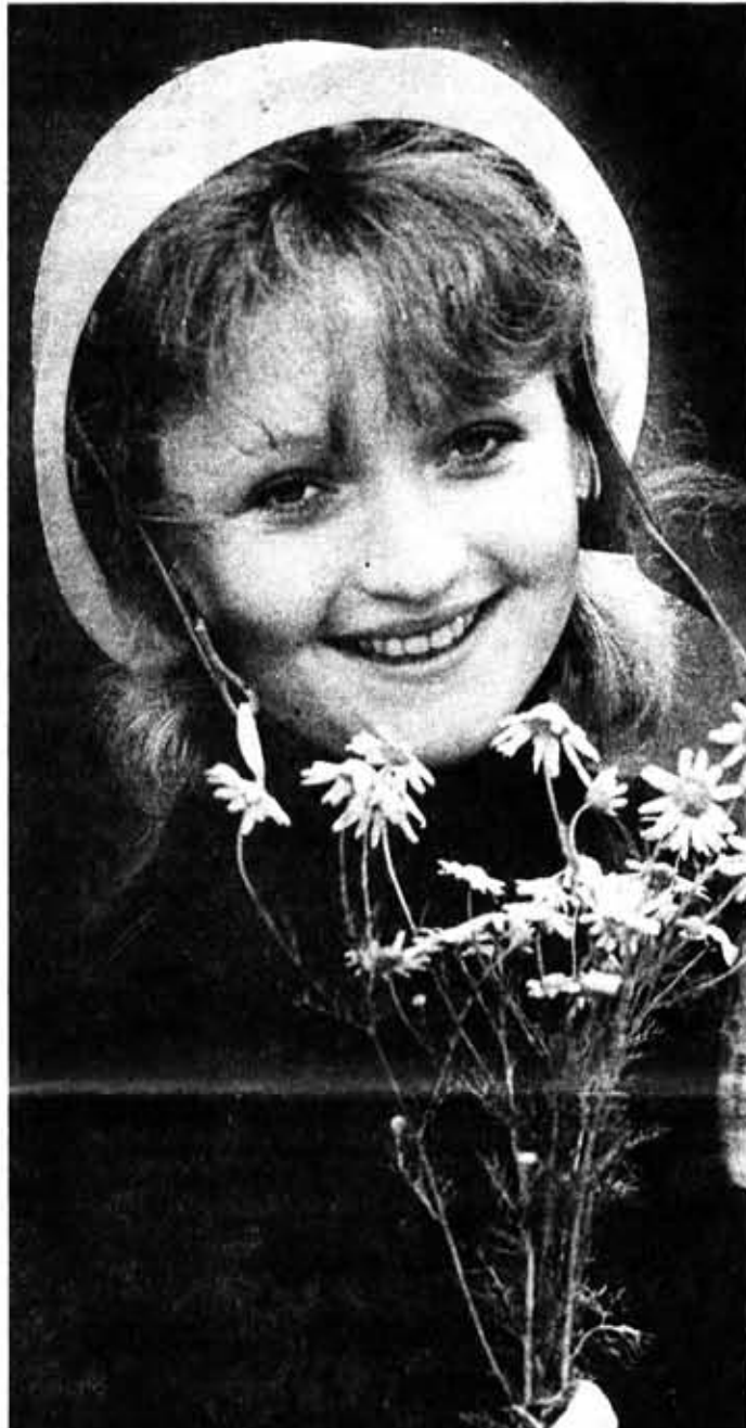
Петлистые шоссейные дороги среди зеленых полей, тонущая в утренней дымке гладь залива, и сосны, стройные, корабельные, с вершинами, уходящими в небо. Сюда, в Ломоносовский район, бойцы РСО «Балтика» выезжают уже более десяти лет. В этом году здесь трудятся пятнадцать отрядов. Им предстоит освоить 860 тысяч рублей капиталовложений. Объекты работы различны: это и реконструкция Русско-Высоцкой птицефабрики, и строительство племрепродуктора