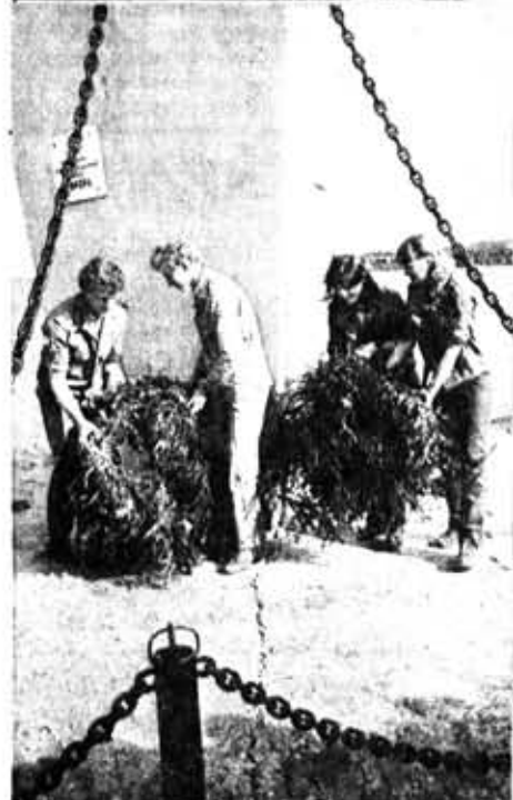
«Балтика»: настроение — строить!