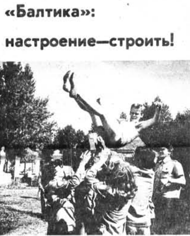
«Балтика»: настроение — строить!

Вышел! Дальше! Быстрее! В программе военно-патриотического слета, который пройдет в районе отряда, и различные спортивные соревнования, и воинские эстафеты, и конкурс строя и песни. Антивоенные литературно-музыкальные композиции подготовили отрядные агитбригады. Поздно вечером разбегались отряды, но надолго запомнится всем этот праздник, так сдруживший всех.