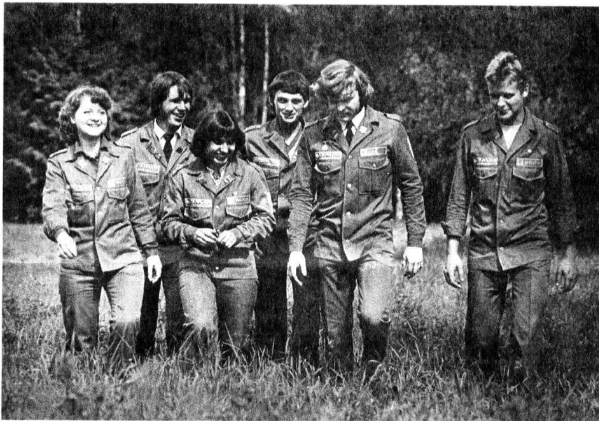
С утра была работа, и, казалось, нет больше сил. А сейчас, когда рядом идет друг, от усталости не осталось и следа. Ведь вечером он возьмет в руки гитару, и к тебе снова вернутся силы, чтобы завтра на объекте сделать еще больше