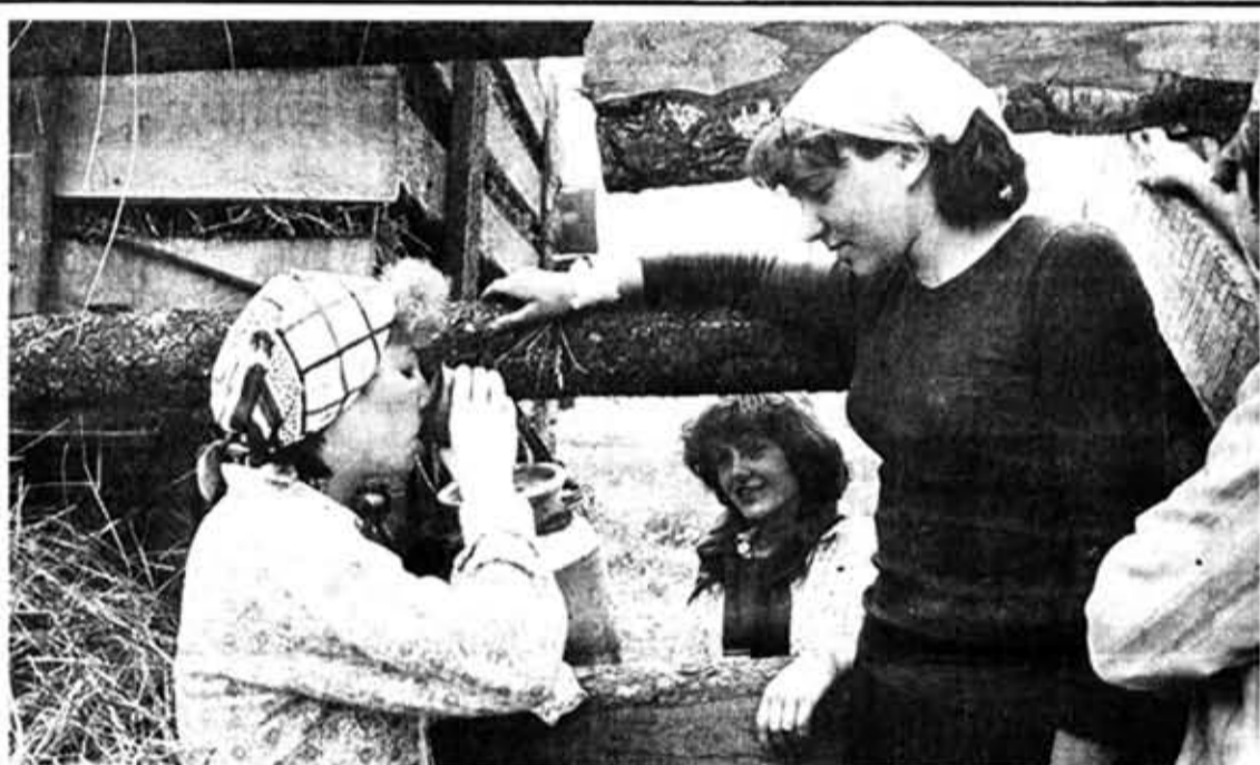
♦ Жаркий полдень.