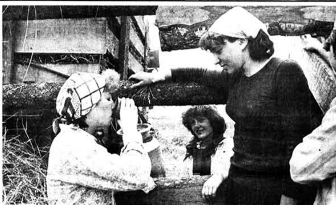
♦ Жаркий полдень.