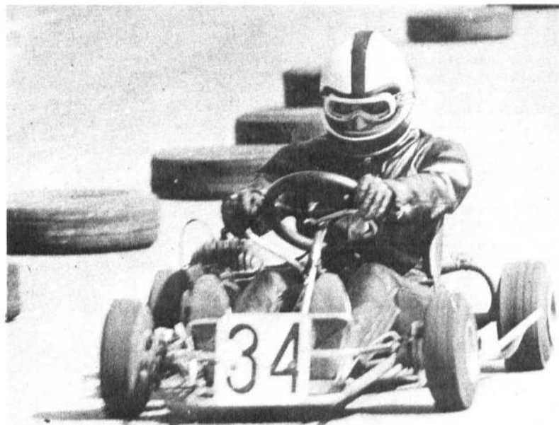
Все быстрее, Мчится время, все быстрее, Время стрессов и страстей Мчится все быстрее.