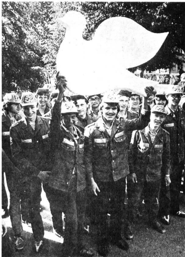
Не дадим взорвать мир!