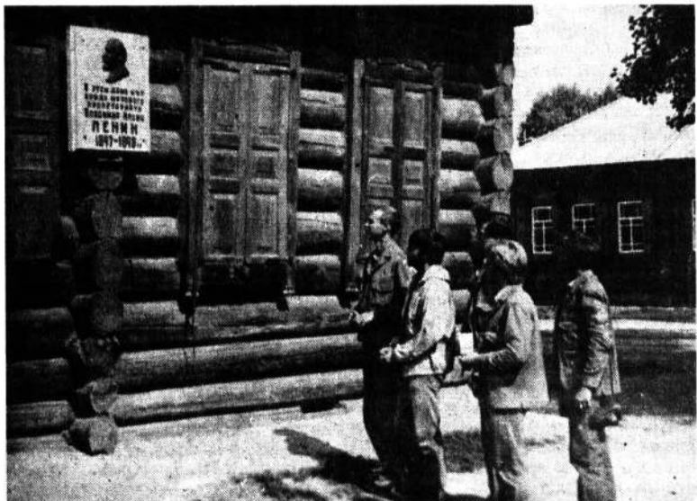
На снимке: бойцы отряда «Энергия» Завода-вуза на экскурсии у домика В. И. Ленина в Шушенском.