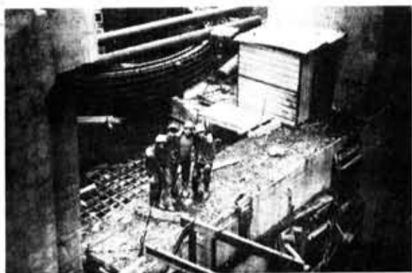
Саяно-Шушенская ГЭС — Всесоюзная ударная стройка комсомола. Одиннадцать отрядов РСО «Ленинград» из города на Неве трудятся на самых разных объектах плотин, благоустроивают поселок гидростроителей Черемушки. Сегодня наш рассказ о победителе социалистического соревнования РСО — отряде «Меридиан».