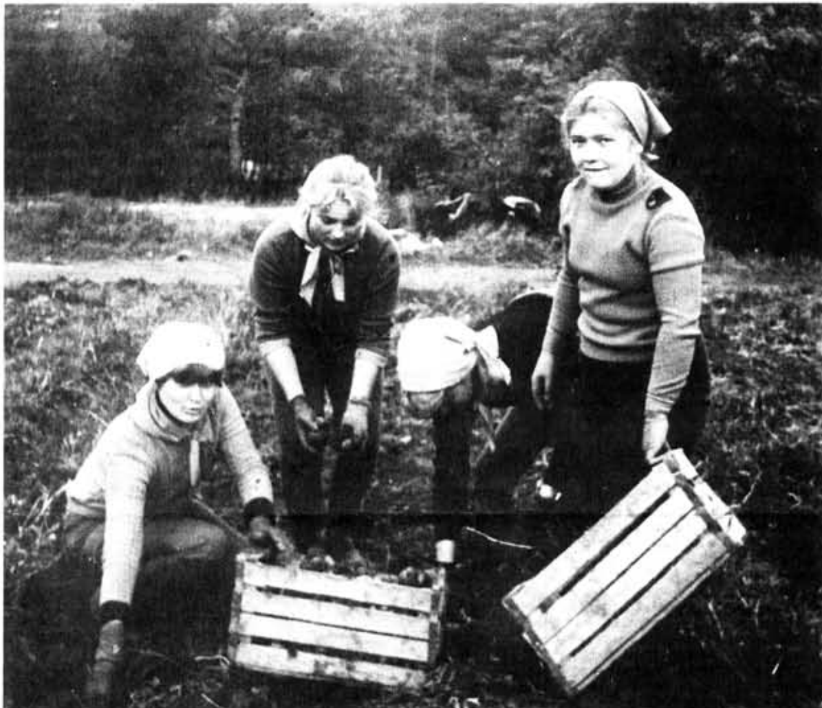
На черно-белой фотографии не видно, что девочки, запечатленные на снимке, работают в красных косынках. Именно так решили отметить лидеров соцсоревнования бойцы уборочного отряда «Эдельвейс» из СГПТУ-109. Ведь за ними, лидерами, обычно не успеешь. Час на борозде, и они уже где-то впереди, не догонишь. А тут яркие косынки

Сельскохозяйственный отряд учетно-экономического факультета Ленинградского финансово-экономического института имени Н. А. Вознесенского рапортует: плановое задание по уборке картофеля перевыполнено. К новым заданиям по претворению в жизнь Продовольственной программы партии готовы. М. ДОНЧАК, командир ССХО, В. УЧАЙКИН, комиссар ССХО