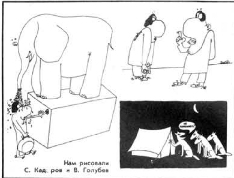
Нам рисовали С. Кадоров и В. Голубев

— Отдайте-ка шпалгалочку! — Это... не шпалгалка,— сказала Маша дрожащим голосом. — Яковлева! Дайте мне то, что передал вам Ящиков!