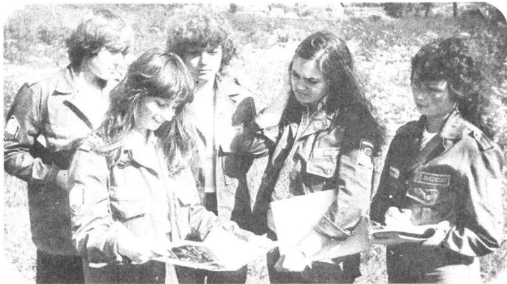
Бойцы «Контакта» готовятся к собранию.

Где найти резервы производительности? Что конкретно каждый может сделать в третьем трудовом? Эти и другие вопросы обсуждались вчера на комсомольском собрании в ленинской комнате ССО «Контакт».