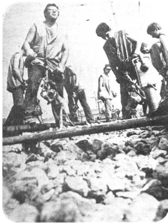
«Мир» за работой.