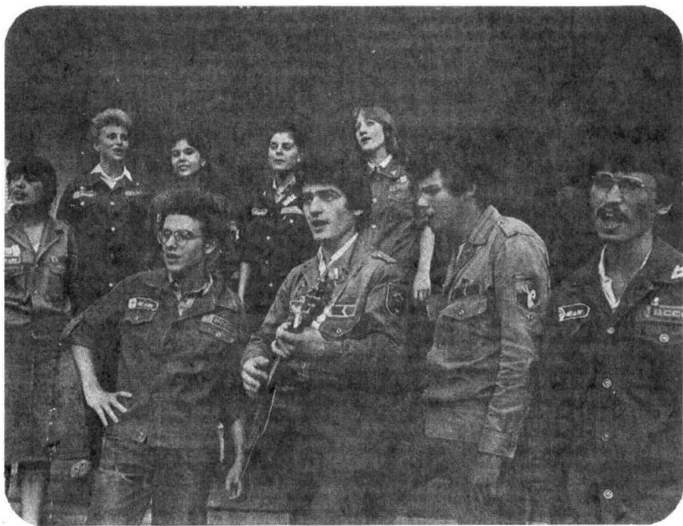
Агитбригада ССО «Панацея» ЛМИ имени академика И.П.Павлова заняла первое место в смотре агитбригад ЗСО «Медик»