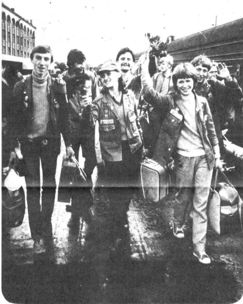
Отряд «Поморы» вернулся домой не просто так — с трофеями. Только вряд ли вы найдете их в чемоданах. Они — в улыбках и настроении студентов техникума морского приборостроения. Отснятые пленки — тоже трофей. В непролазных кадрах замерли пейзажи республики Коми, поселок Тракт, который благоустрива-

А. ОБРУЧЕВ, комиссар отряда «Колумб» ЛКИ