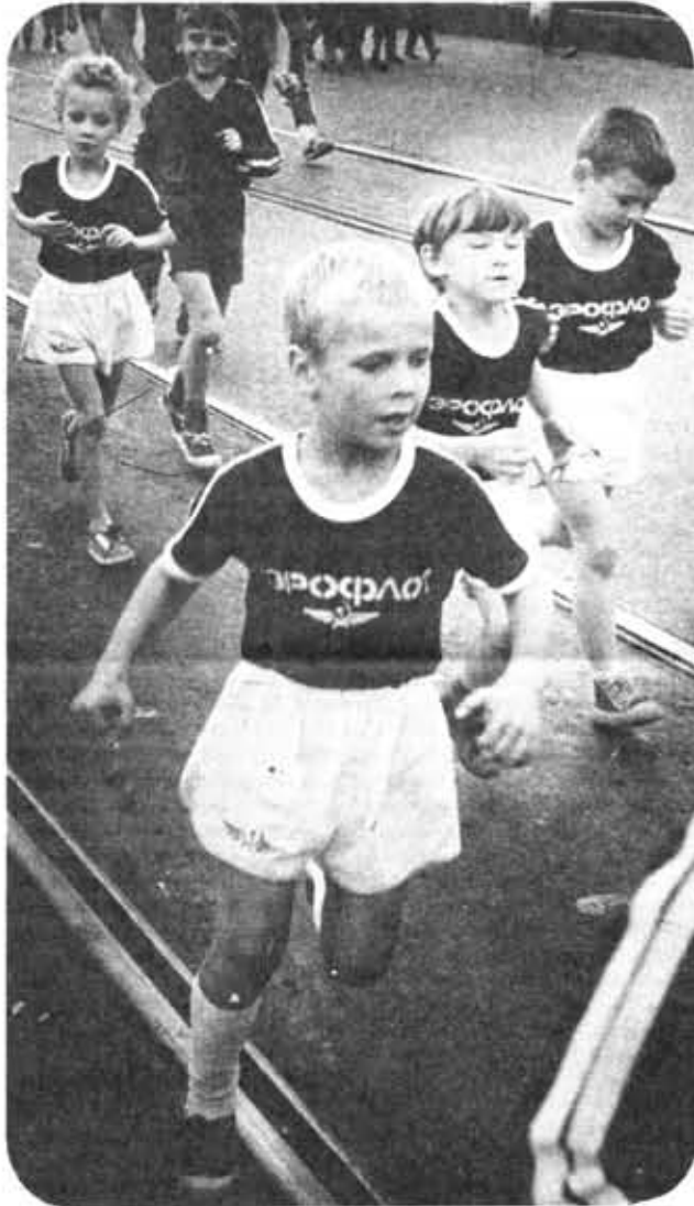
В минувшее воскресенье в Ленинграде прошел Всесоюзный день бегуна, в котором приняли участие более 25 тысяч человек. Старт массовому пробегу был дан на Дворцовой площади. Дистанция от 1 до 10 километров, и каждый выбирал ее себе по желанию. Самому старшему участнику пробега было 88 лет, самому маленькому всего 3 года. Были и прыжки пробега, были и те, кто зотел на старт, но так и не стал. А победила, конечно, дружба.