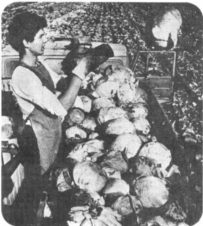
КАК ДЕЛА, ИНИЦИАТОР!