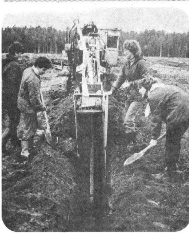
Бойцы отряда «Энтузиаст» Института водного транспорта помогают мелнораторам давать «вторую жизнь» полям совхозов Кингисеппского района. На снимке А. Владимировича вы видите, как одна из бригад отряда готовится к укладке дренажа.

— Большая часть из написанного мной действительно достаточно автобиографична. Обстановка, где происходит действие — институт, кафедра, — это не просто знакомая мне среда, это моя среда. Кое-что из описанного происходило на самом деле — и совместная работа с грузинскими товарищами, как в «Глаголе «инженер», и поездка в совхоз в «Сене-солومه», и встреча с сельским изобретателем в «Эффекте Брума». Кстати, кроме повестей, у ме-