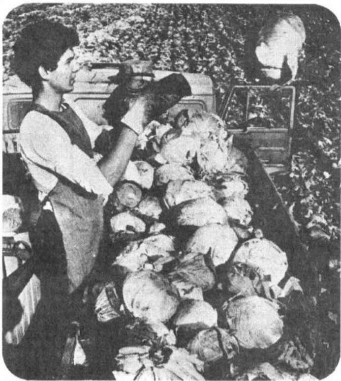
КАК ДЕЛА, ИНИЦИАТОР!