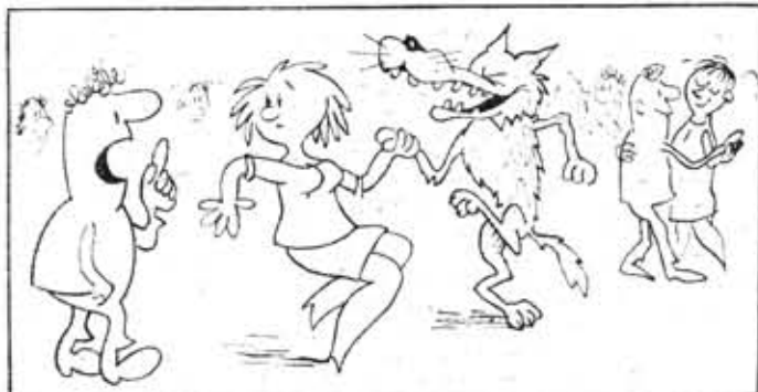
— еще раз говорю тебе: не танцуй с хулиганом!