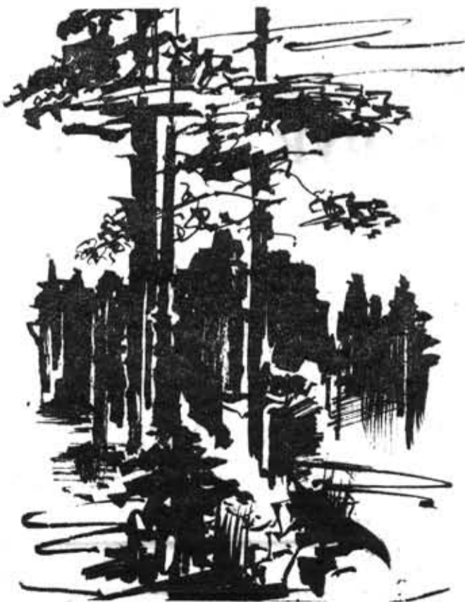
«Штрихи Карелии». Рисунок В. Баунова.