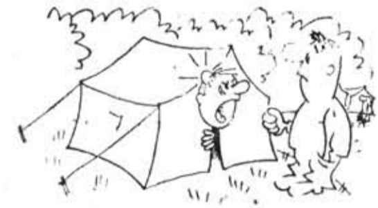
— Я же тебя просил: входи без стуна... Рис. В. Милейко