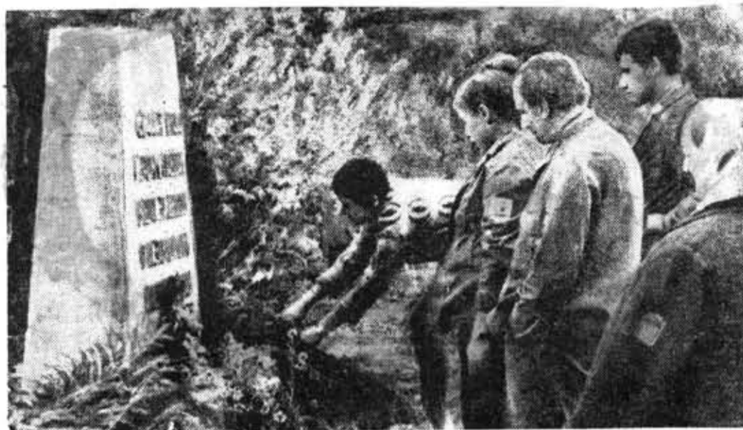
Братские могилы... Их много на ленинградской земле, которая пережила страшные войны и видела мужество и героизм борцов за дело революции, за счастье Советской страны. Студенты часто посещают места сражений. Вот и в этот воскресный день студенты ЛКИИ