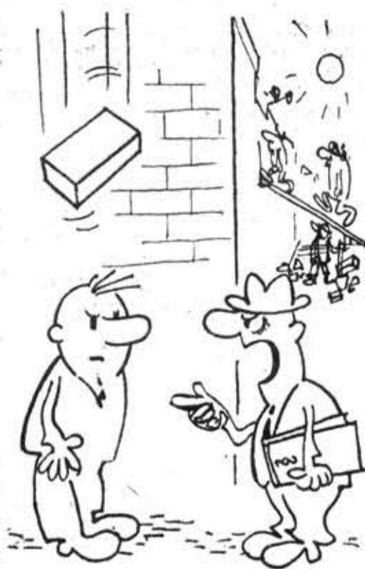
— За технику безопасности вы отвечаете головой!