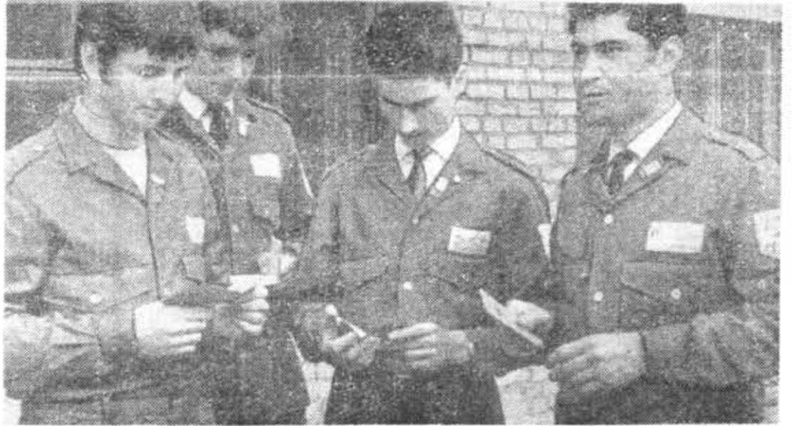
Первые дни на стройке. Бойцы отряда «Факел» получили комсомольские путевки.

Не говорят здесь и о романтике (вообще шипит к ней модно относятся несколько провинциалов). Но когда ребята ехали по автострате, шипит же провинциал над лирическим настроением «старичков», вспоминавших чуть ли не каждый камень на обочине: ведь это они в позапрошлом году строили эту дорогу. И, чего уж там говорить, все-таки дорожно где-то на краю земли оставить