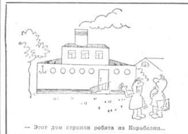
— Этот дом строили ребята из Корабелки...