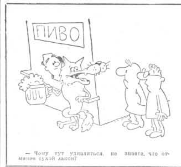
— Чему тут удивляться, не знаете, что отменили сухой закон?