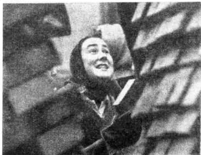
Как там оно, на стройке!

P. S. Целинологи продолжают работу. Наша рубрика «Целиноанкета» открыта для всех желающих.