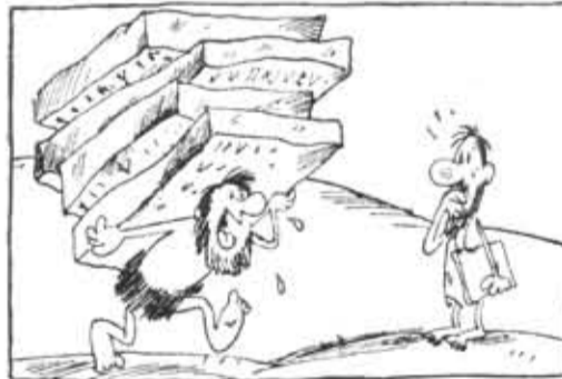
ИЗ СЕРИИ «СТУДЕНТ КАМЕННОГО ВЕКА». — Нужно срочно переписать конспекты!!!