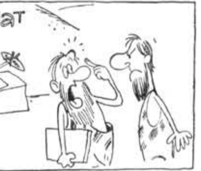
— За прогулы получил строгий выговор...