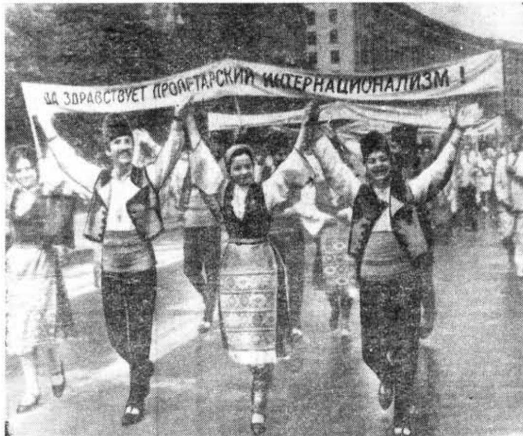
Киев. На фестивале дружбы советской и болгарской молодежи. На снимке: во время манифестации на Крещатке.

В ответ на призыв партии, прозвучавший с трибуны VIII пленума ЦК ПОРП, Союз социалистической молодежи разработал конкретный план действия дальнейшему развитию строительства жилых домов. На строительные площадки этим летом выйдет 32 тысячи юношей и девушек — членов Союза социалистической молодежи, объединенных в добровольные рабочие отряды.