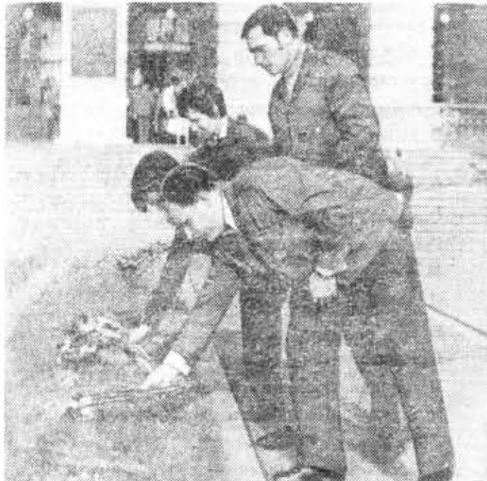
Бойцы Ленинградского студенческого строительного отряда возлагают цветы и подножью памятника В. И. Ленину у Смольного.