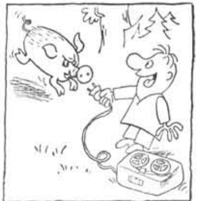
Какой же отдых без музыки!