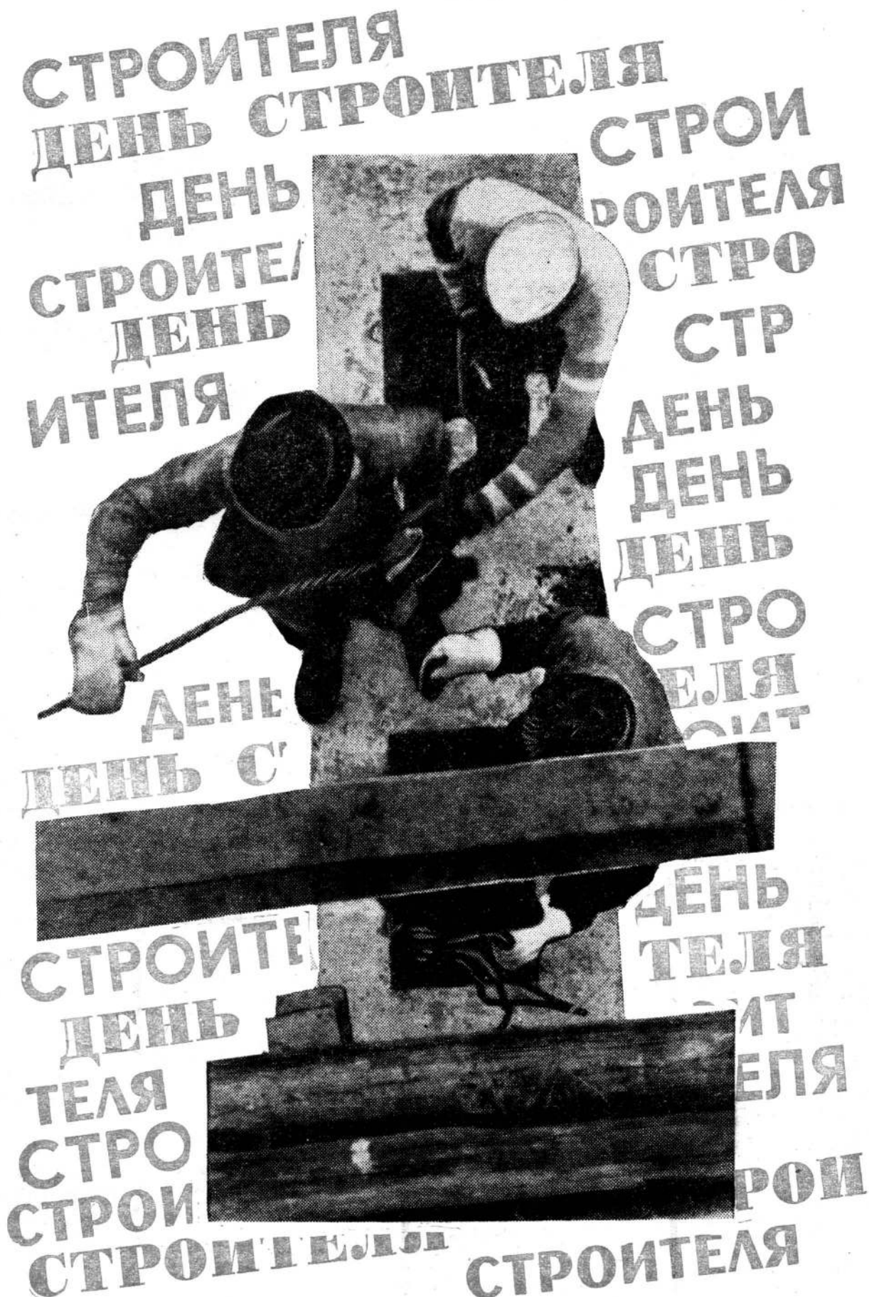
Плакат В. Вазунова и Ю. Чижикова

Впереди две декады — последний вираж, финишная прямая и финиш — возвращение домой, в вуз. И каждый день до финиша будет таким же нелегким рабочим днем, как любой день августа. Стройка — в зените, стройка — в центре внимания. Подводятся итоги соцсоревнования. Выявляются первые победители — лидеры третьего семестра. За ними вплотную идут многие другие. Соревнование продолжается в высшем студстроевском темпе. Сильнейшего определит трудовой август. Но на воскресном празднике всмотритесь в ряды ваших товарищей студентов — бойцов ССО. В глазах каждого из них — только победа!