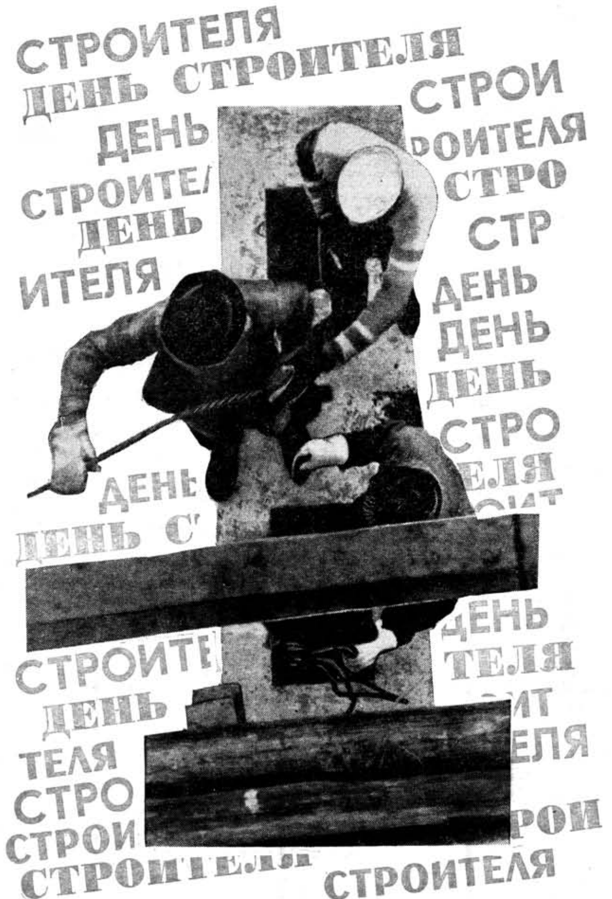
Плакаты В. Вазунова и Ю. Чижикова

Впереди две декады — последний вираж, финишная прямая и финиш — возвращение домой, в вуз. И каждый день до финиша будет таким же нелегким рабочим днем, как любой день августа. Стройка — в зените, стройка — в центре внимания. Подводятся итоги соцсоревнования. Выявляются первые победители — лидеры третьего семестра. За ними вплотную идут многие другие. Соревнование продолжается в высшем студстроевском темпе. Сильнейшего определит трудовой август. Но на воскресном празднике всмотритесь в ряды ваших товарищей студентов — бойцов ССО. В глазах каждого из них — только победа!