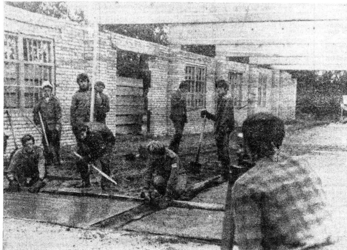
Метр за метром ложится бетон в новом цехе переработки плодов совхоза «Сиреблово». Бойцы отряда «Ладого-8» (ЛЭТИ, командир Г. Агранов) торопятся успеть и сроку: скоро домой, а объект сдасточный.

ПУСТЬ УЛИЦЫ ВСТАНУТ, ГДЕ НАШИ ОТРЯДЫ ПРОЙДУТ! ПУСТЬ ЭТОТ ЭКЗАМЕН НАМ ВПИШУТ С ТОБОЮ В ДИПЛОМЫ!