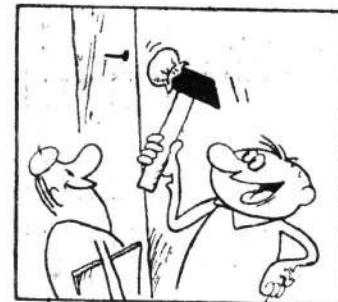
Такой молоток работает совершенно бесшумно.

Он встал и спросил: «Все же, кто подсовывает ложку дегтя в русло мирно текущей ежедневной работы нашего отряда?»