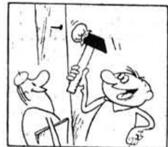
Такой молоток работает совершенно бесшумно.

Он встал и спросил: «Все же, кто подсовывает ложку дегтя в русло мирно текущей ежедневной работы нашего отряда?»