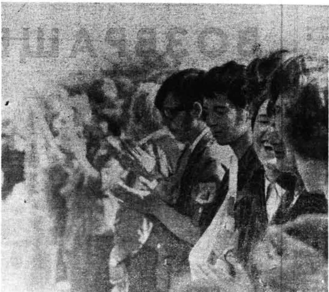
И грустно и радостно студентам-медикам Санитарно-гигиенического института. Позади осталось напряженное студенческое лето, проведенное в Волосовском районе. Пришла осенняя пора, закончена целинная регата, время подводить итоги.