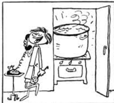
— За обед, мамочка, не беспокойся: летом я готовила на целый отряд!