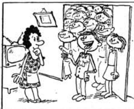
— Я пригласил на чашку чая ребят, с которыми работал!