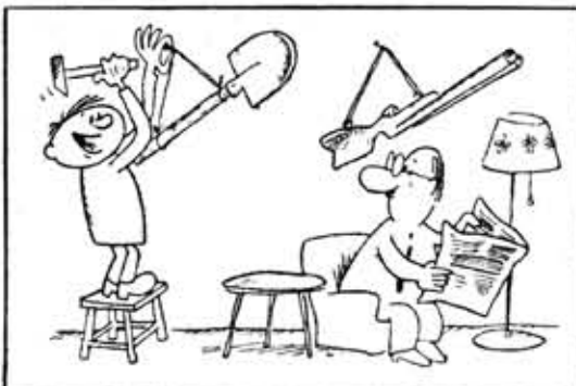
— В будущем году опять поеду на стройку!