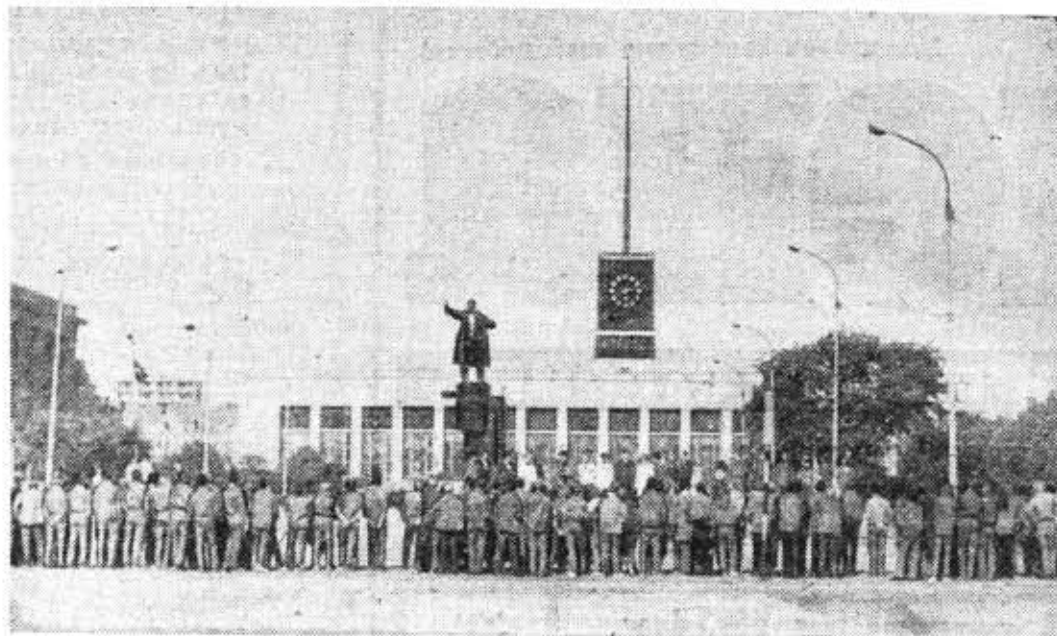
Замер строй. Затрепетали над ним отрядные флаги. Бойцы районного студенческого строительного отряда «Калининский» торжественно прощаются с трудовым летом.