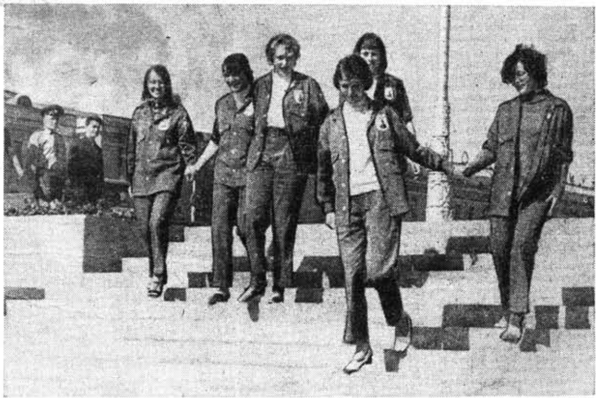
Кажется, совсем недавно уезжали на стройку студенты ленинградских вузов и техникумов. И вот осталось несколько ступенек — и родной город примет их в свои объятия. (Читайте 2-ю стр.)