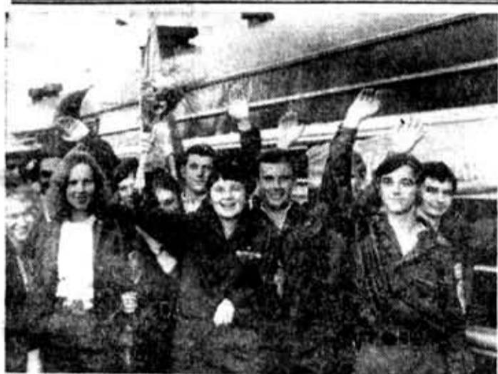
«50-летию образования СССР — ударный труд московских студентов» — под таким девизом будет проходить третий трудовой семестр у наших коллег из столицы.

В этом году 45-тысячному отряду московских студентов предстоит выполнить объем работ примерно на 80 миллионов рублей.