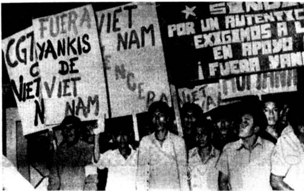
Молодые латиноамериканцы выступают против американской агрессии в Индокитае, против бомбардировок городов Демократической Республики Вьетнам.

На снимке: перуанские рабочие и студенты проходят по улицам Лимы с лозунгами: «Вьетнам победит!», «Янки, вон из Вьетнама!».