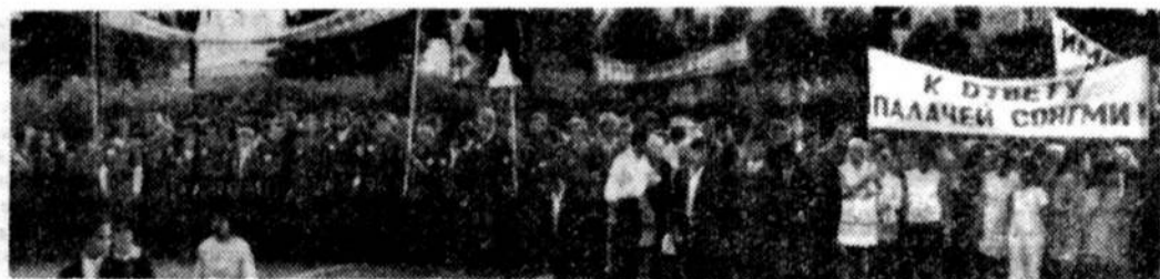
Бойцы районного отряда «Фрунзенский» на митинге солидарности с народом борющегося Вьетнама.