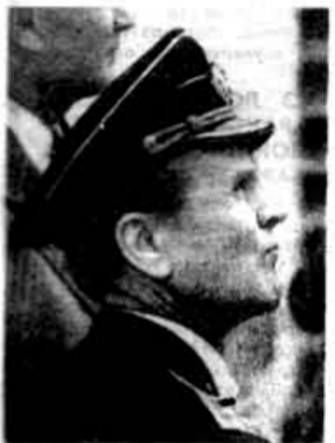
Маршал И. С. Конева прислал телеграмму: «...Памятник защитникам Рыбачьего, который создан руками юнк, — свидетельство неослабного уважения к ратному подвигу советских воинов, верность делам и свершениям старшего поколения...»

Их путь лежал на полуострове Рыбачий и Средний — места боев, землю их молодости и зрелости. Здесь стояли на сцене «Героическая защита Заполярья», — писала газета «Правда» 6 декабря 1944 года после разгрома там отборных фашистских дивизий. — войдет в историю нашего народа как одна из самых ярких, самых запоминающихся страниц. Здесь враг был остановлен осенью 1941 года. Здесь находится участок, где врагу в течение всей войны не удалось перешагнуть линию нашей государственной границы. На этот участок лежал путь ветеранов. И совпал он с маршрутом комсомольского похода по местам воинской славы. Совпал не случайно. На полуострове Рыбачьем открывался памятник. Именно это торжество стало поводом к встрече ветеранов.