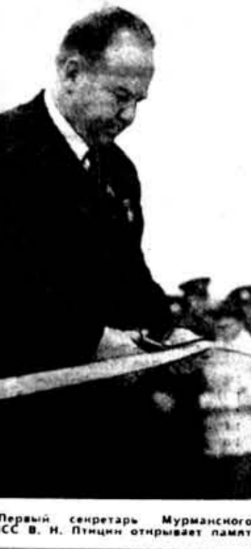
Первый секретарь Мурманского обкома КПСС В. И. Птицын открывает памятник.