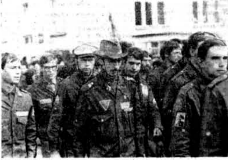
На пути и причалу.