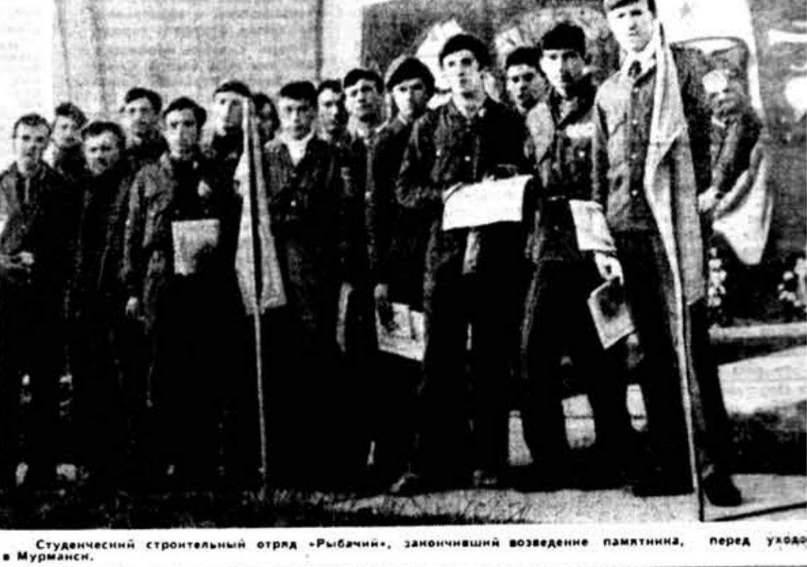
Студенческий строительный отряд «Рыбачий», закончивший возведение памятника, перед уходом в Мурманск.

М. БЕЛОУСОВ, спец. корр. «Смены» Полуостров Рыбачий — Ленинград