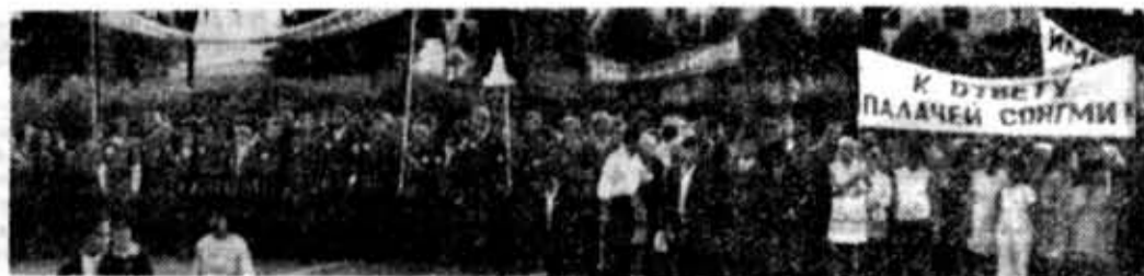
Бойцы районного отряда «Фрунзенский» на митинге солидарности с народом борющегося Вьетнама.