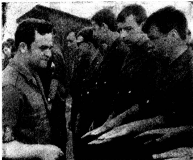
Боб-Доб, или руки перед собой! — проверка.

— Железная же у тебя ло- гика, Гена. — Нет у меня никакой ло- гики.