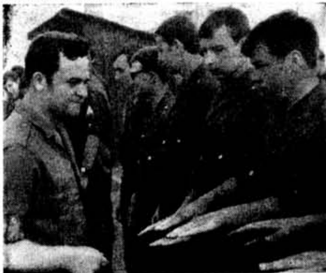
Боб-Доб, или руки перед собой! — проверка.