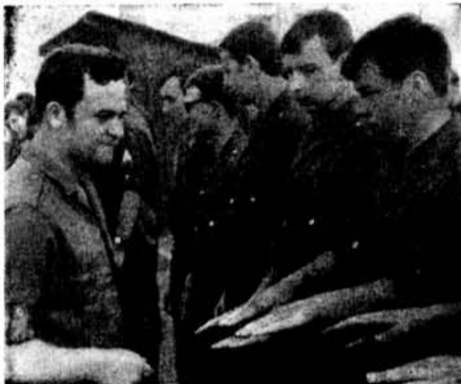
Боб-Доб, или руки перед собой! — проверка.

— Железная же у тебя ло- гика, Гена. — Нет у меня никакой ло- гики.