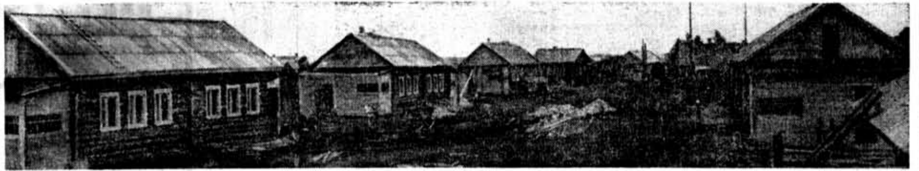
Так выглядит Студенческая улица.