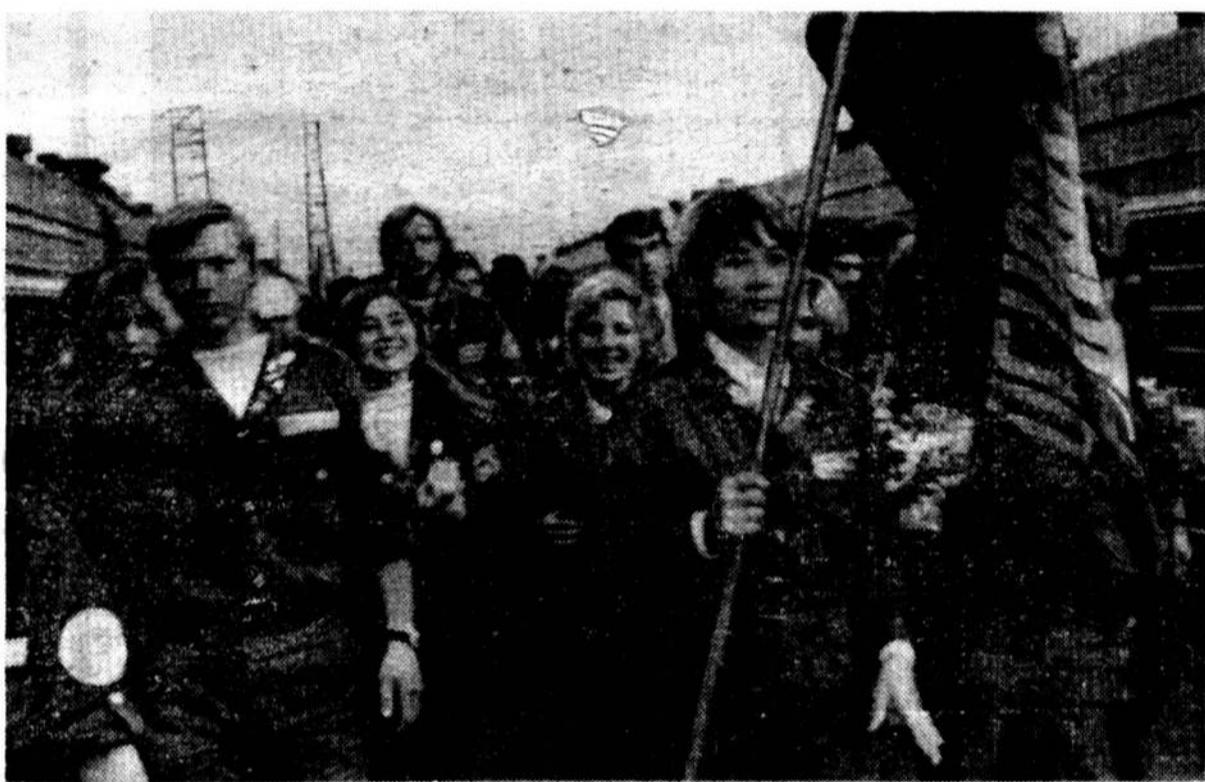
Из далекой Коми АССР возвращается отряд Политехнического института имени М. И. Калинина.

Планета Целина прощается сегодня с вами и ждет снова. До новой встречи, дорогие друзья!