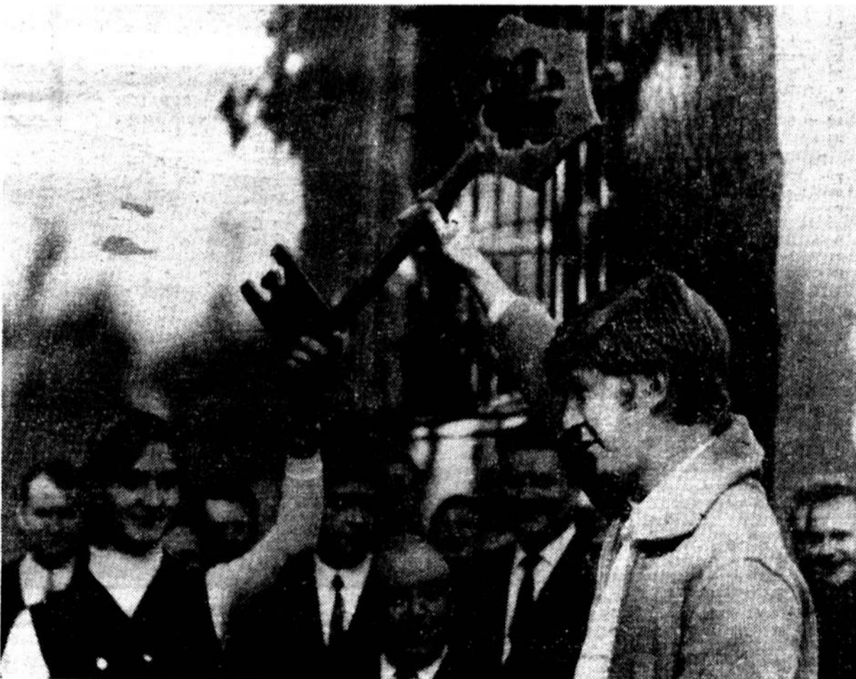
Символический ключ знаний принимают студенты-первокурсники Электротехнического института имени В. И. Ульянова (Ленина).