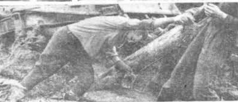
На снимке: рука друга.

В зеленом театре состоялся концерт студенческой самодеятельности, собравший аплодисменты всего гатчинского парка. Вечером в клубе механического завода студенты провели КВН.