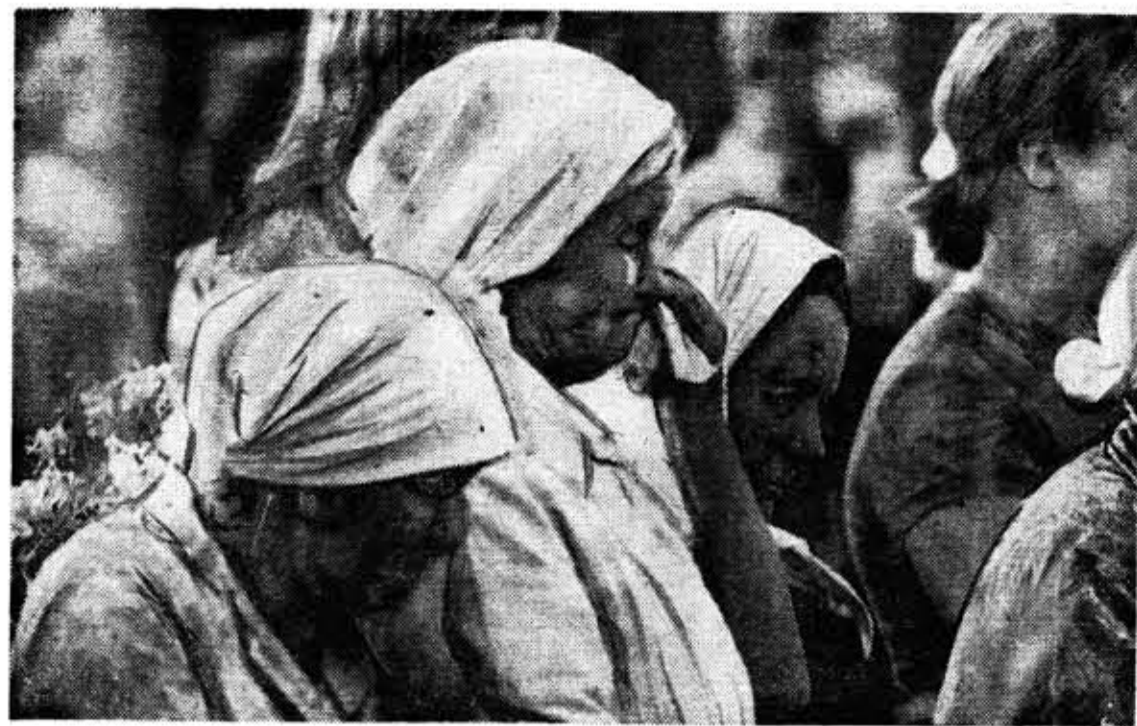
Фоторепортаж наших корреспондентов И. Туркова и Л. Маркина из Киришского района