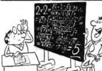
● Воспоминания о сессии. — Я все проверил, ошибки быть не может.