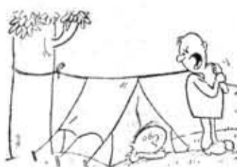
● — Проснись, твоя очередь.