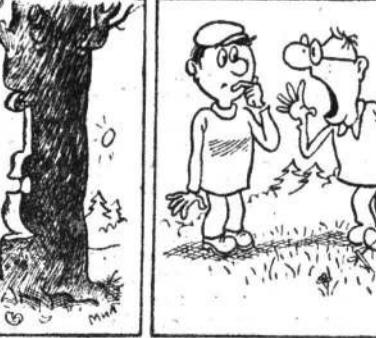
— По-моему в палатке кто-то есть! Рисунки В. МИЛЕЙКО