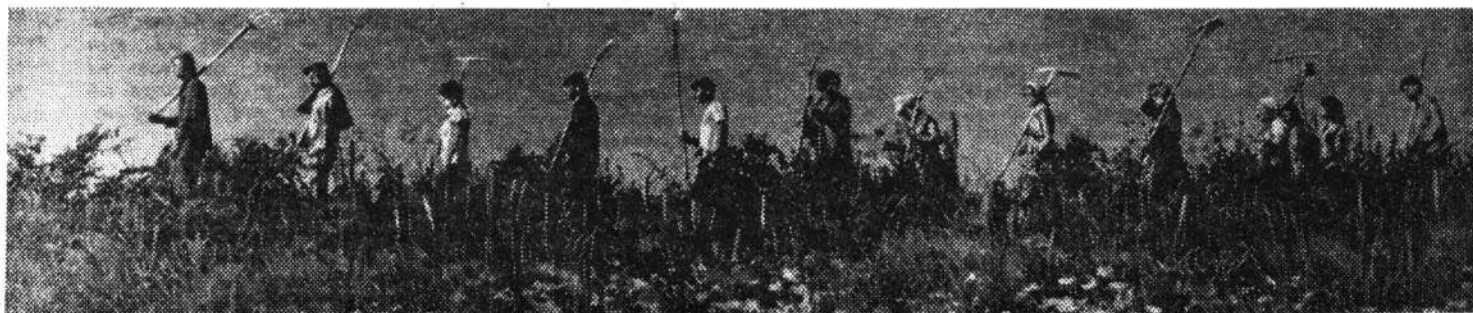
Бойцы РСО «Лужский» на субботнике по заготовке кормов.

Ленинградский областной комитет ВЛКСМ Ленинградский городской комитет ВЛКСМ