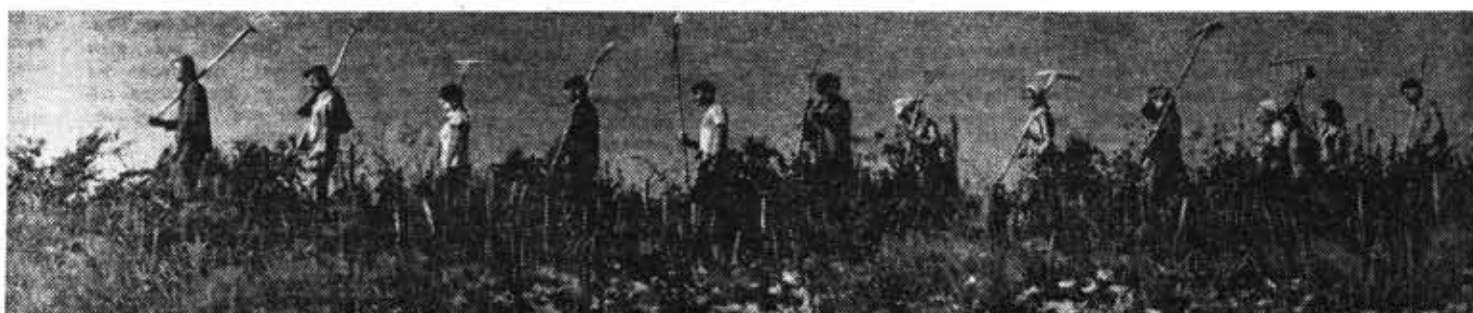
Бойцы РСО «Лужский» на субботнике по заготовке кормов.

Ленинградский областной комитет ВЛКСМ Ленинградский городской комитет ВЛКСМ