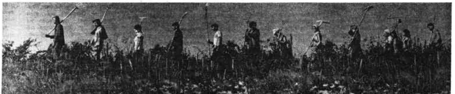
Бойцы РСО «Лужский» на субботнике по заготовке кормов.

Ленинградский областной комитет ВЛКСМ Ленинградский городской комитет ВЛКСМ