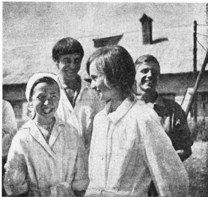
Совхоз «Сяглицы» Волосовского района. Ученическая