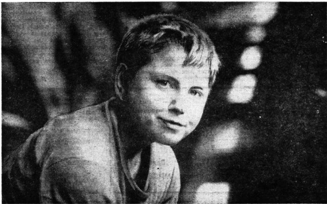
производственная бригада Большеврудской средней школы. Дружно, весело, с азартом работают ребята!

Так думали, впрочем, и сами бойцы «Мечты», узнав о новом объекте работ в разгар трудового семестра. М. ЕЛЬЦИН, наш корр.