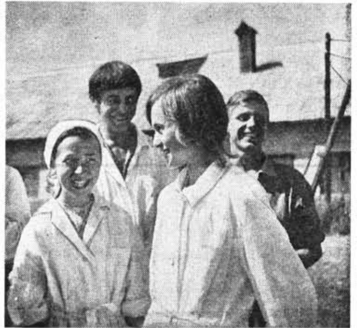
Совхоз «Сяглицы» Волосовского района. Ученическая