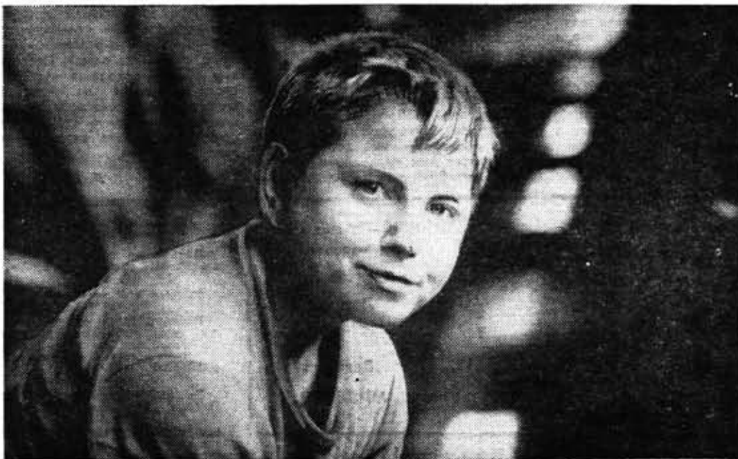
производственная бригада Большеврудской средней школы. Дружно, весело, с азартом работают ребята!

полезен, потому что большинство его членов — новички в районном звене.