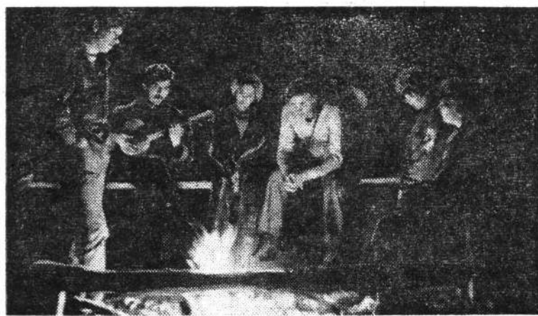
Хорошо хоть немного посидеть у костра...

Непростым оказалась работа — уборка помидоров. Пять часов под жгучим, палящим солнцем. Пять часов в наклонку. Пять часов дурманящего запаха разомлевшей от жары ботвы. И все же, к чести ребят, никто не ныл, ни один из 115 ленин-