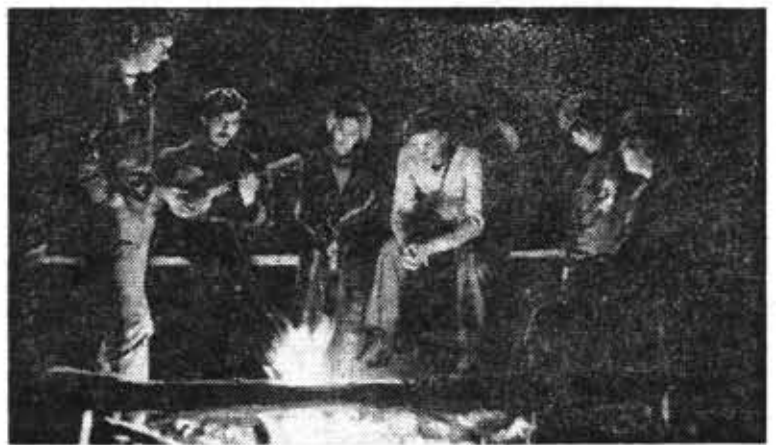
Хорошо хоть немного посидеть у костра...

Непростым оказалась работа — уборка помидоров. Пять часов под ягучим, палящим солнцем. Пять часов в наклонку. Пять часов дурманящего запаха разомлевшей от жары ботвы. И все же, к чести ребят, никто не ныл, ни один из 115 ленин-