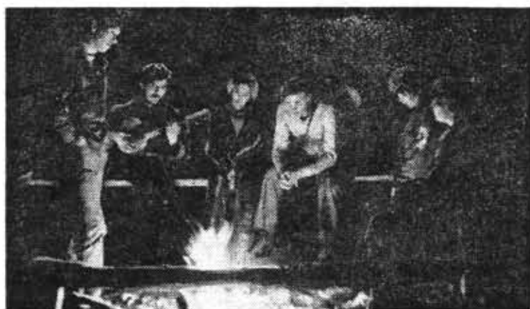
Хорошо хоть немного посидеть у костра...

Непростым оказалась работа — уборка помидоров. Пять часов под ягучим, палящим солнцем. Пять часов в наклонку. Пять часов дурманящего запаха разомлевшей от жары ботвы. И все же, к чести ребят, никто не ныл, ни один из 115 ленин-