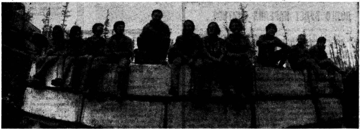
ОТРЯД ЛЕНИНГРАДЦЕВ РАБОТАЕТ НА СТРОИТЕЛЬСТВЕ МОСТА ЧЕРЕЗ ЛЕНУ.