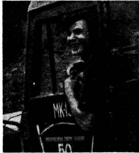
● ФОТОРЕПОРТАЖ ДНЯ ●