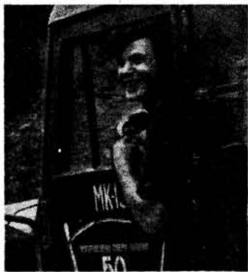
● ФОТОРЕПОРТАЖ ДНЯ ●