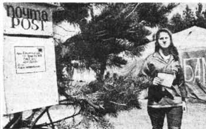
● На укладке вторых путей действующей магистрали Тайшет — Лена, важном участке БАМа, работают бойцы интернациональных студенческих отрядов из вузов нашей страны. Вместе с советскими друзьями трудятся посланцы ГДР, Венгрии, Чехословакии, обучающиеся в СССР.