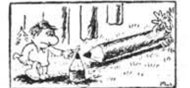
Без слов. Рис. Вал. Милейко