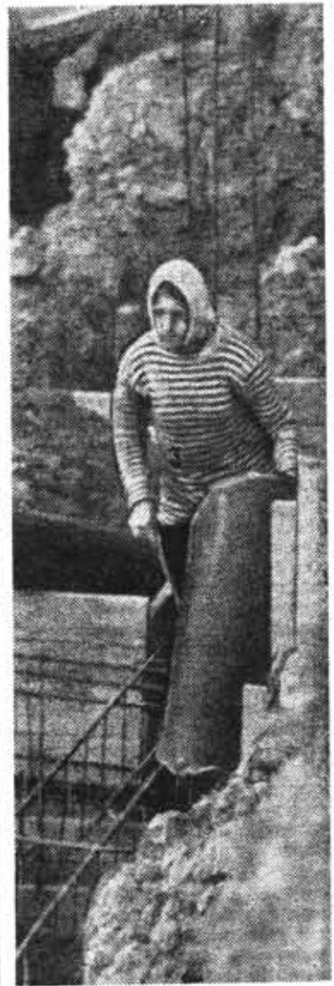
● Перед укладкой бетона.

В НАХОДКУ, на жестяно-баночную фабрику, завезена первая партия оборудования. Этому рядовому в масштабах страны событию «Маяк» уделен чет-