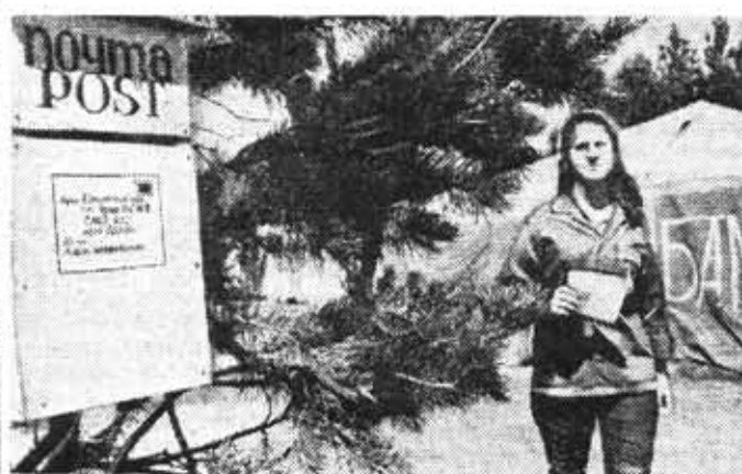
На укладке вторых путей действующей магистрали Тайшет — Лена, важном участке БАМа, работают бойцы интернациональных студенческих отрядов из вузов нашей страны. Вместе с советскими друзьями трудятся посланцы ГДР, Венгрии, Чехословакии, обучающиеся в СССР.