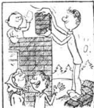
— Хорошо, что Коля у нас баскетболист.