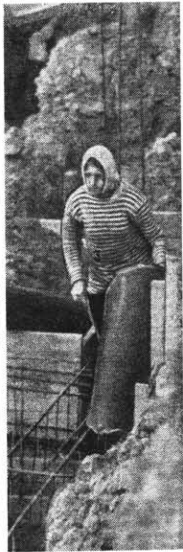
● Перед укладкой бетона.

В НАХОДКУ, на жестяно-баночную фабрику, завезена первая партия оборудования. Этому рядовому в масштабах страны событию «Маяк» уделен чет-