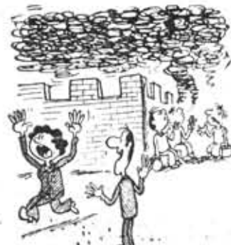
— Ну какой же тут пожар?! Просто у ребят перекур...

Телефон редакции 10-80-68 типография им Володарского Ордена Трудового Красного Знамени Редактор Н. ДЬЯЧЕНКО Наш адрес: Ленинград, 191023, Фонтанка, 59 М-29853 Заказ № 2088